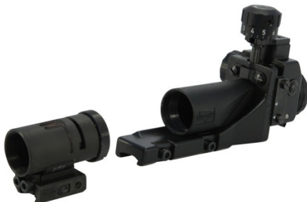
fig.6-2 forreste og bagerste sigte på riffelen

Det bageste sigtemiddel, fig. 6-2 højre side, skal have en hulstørrelse på 1,2 mm, som er standard på de fleste geværer i dag.