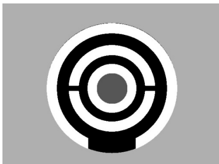
Fig.6-3 illustrer sigte set gennem det bagerste sigte på en riffel, det sorte er selve det forreste sigte. Det grå i center er skiven og det grå uden om er det bagerste sigte.

Den sorte plet - selv skydeskiven ses på fig. 6-3 markeret som grå i centrum - behøver ikke nødvendigvis at stå helt skarpt, da det ikke er selve pletten, man skal fokusere, stille skarpt på. Det er den yderste ring, se fig. 6-3, rundt om den pletten, man skal se på. Når der er lige meget lys hele vejen rundt, er sigtet korrekt. Så det kan derfor være en fordel, hvis den sorte plet står lidt "ulden" i kanten.