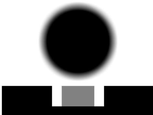
fig.6-4 grå boks er foreste sigte, sort er kærven, den sorte cirkel er skivens orienteringspunkt. Toppen af kornet skal flugte toppen af kærven

Den sidste faktor i sigte-systemet er så skiven og dens orienteringspunkter. Og endelig fremkommer god sigtning så derved, at disse tre ting – kærve, korn og skivens plet placeres i forhold til hinanden, som vist i fig.6-4.